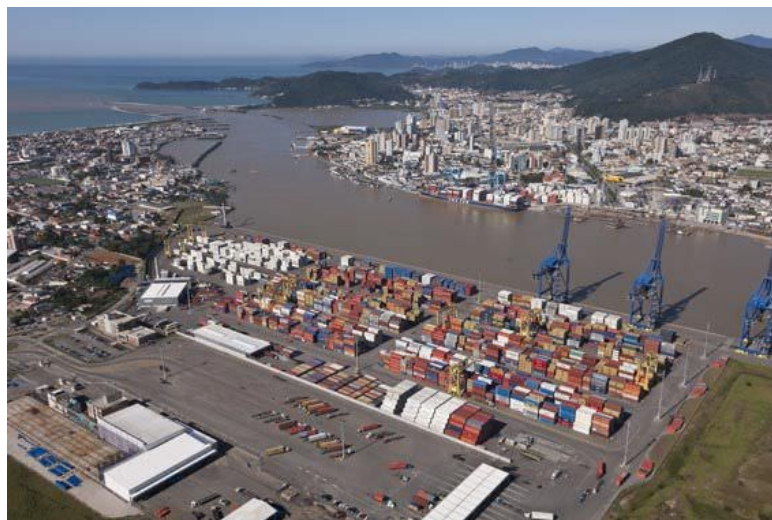
Porto de Navegantes.

Na ação, o sindicato solicitou o estabelecimento de preço-teto para a cobrança. Segundo o voto do relator do processo, o diretor da Antaq, Francisval Mendes, a regulação de preço é medida considerada extrema e sensível. “A decisão considerou também a existência de um mercado aquecido com diversos concorrentes e que os preços são livres”, afirmou Mendes em seu voto.